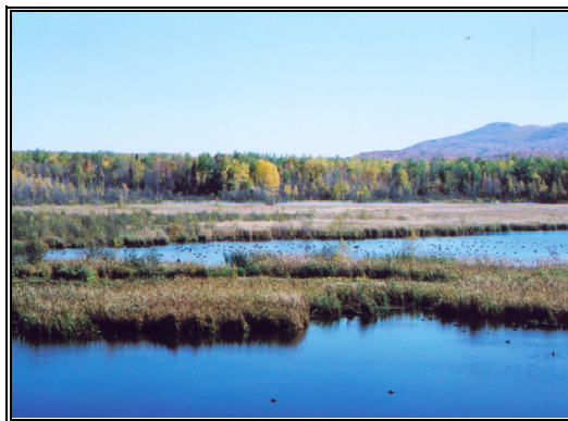
Centre d'interprétation de la nature du lac Boivin