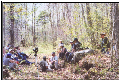
Fiducie de la vallée Ruiter

Site d'un grand intérêt ornithologique : Buse à épauettes, Petite Buse, Chouette rayée, Merlebleu de l'Est, Grives des bois, fauve et solitaire, Piranga écarlate, Viréos aux yeux rouges, à tête bleue, plusieurs espèces de moucherolles, de bruants et de parulines.