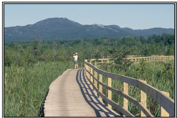
Marais de la rivière aux Cerises

Nicheurs : Harle couronné, Canards branchu, colvert et noir. Observations : Grand Héron, Héron vert, Bernache du Canada, Grèbe à bec bigarré, Martin-pêcheur d'Amérique, Jaseur d'Amérique. Plus loin, tourner à droite sur le chemin de l'Est, et revenir vers le village par le chemin Channell, on peut observer le Merle bleu de l'Est et le Bruant des champs.