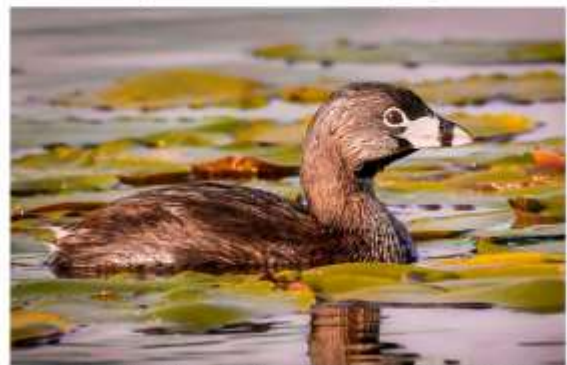
Grèbe à bec bigarré Étang Burbank, 22 mai 2020