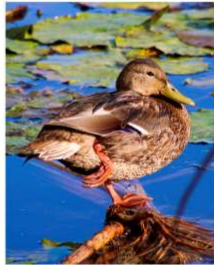
Canard colvert, marais Réal-D.-Carbonneau 18 septembre 2020