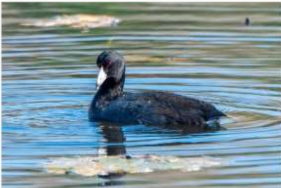
Foulque d'Amérique, marais Réal-D.-Carbonneau 23 octobre 2020