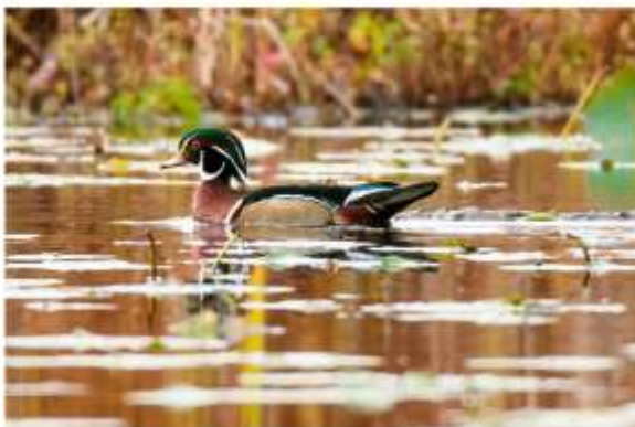
Canard branchu, lac Boivin, Granby, 15 octobre 2020