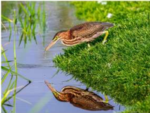
Héron vert, Cowansville, 29 août 2020.