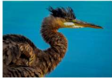
Grand Héron, Lac des Nations, 15 septembre 2020, © Rachel Villeneuve