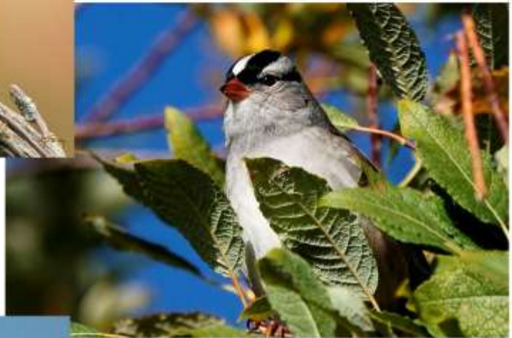
Bruant à couronne blanche Étang Burbank 11 octobre 2020